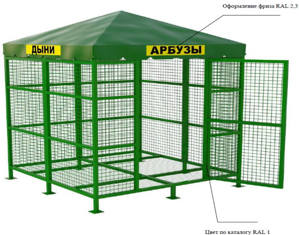
Рисунок 1 (1 секция)